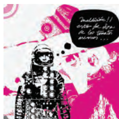
LUJURIA EN EL ESPACIO 2007