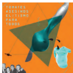
ELITISMO PARA TODOS 2013