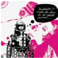
LUJURIA EN EL ESPACIO 2007