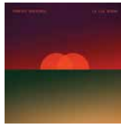
LA LUZ BUENA 2016