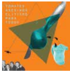
ELITISMO PARA TODOS 2013