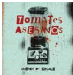
NOCHES DE ABSALÓ 2011