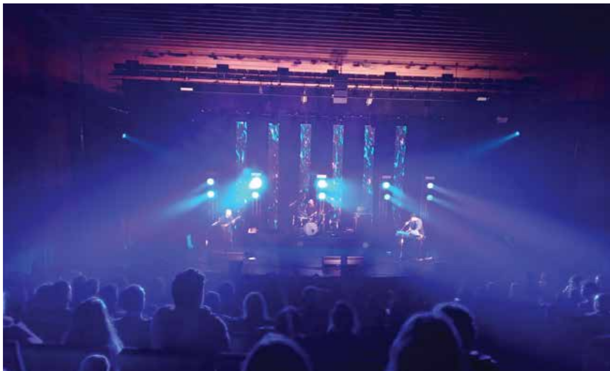
Presentación CCK (abril 2019)

En los últimos años participaron en festivales y fueron afitriones del ciclo La Peña de Los Tomates, compartiendo escenario con Los Espíritus , El Mató a un Policía Motorizado , Daniel Melero , Usted Señalemeló , Mi Amigo Invencible , Carca , Chancha Vía Circuito , Bandalos Chinos , Las Ligas Menores , Nación Ekeko , Weste , entre otros.