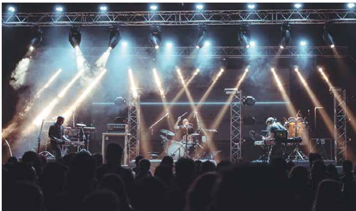
Presentación Espacio Quality (junto a Los Espíritus, octubre 2018)